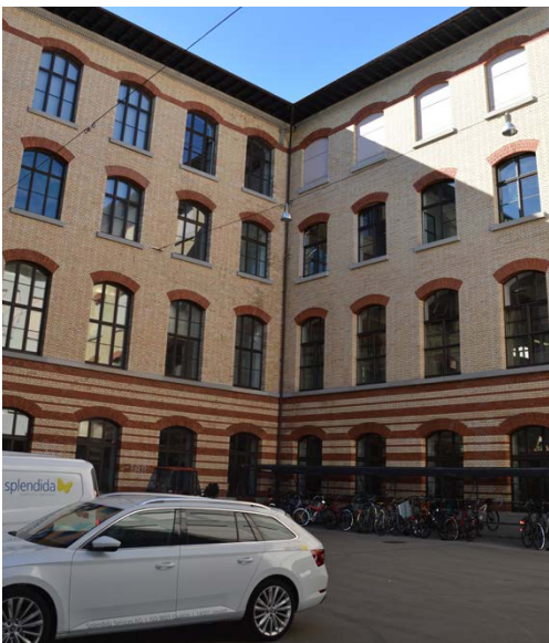
CAB Innenhof Nord