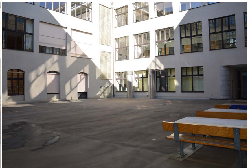
CAB Innenhof Süd

ETH Zürich Abteilung Campus Services Bewilligungen Binzmühlestrasse 130 8092 Zürich