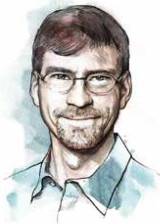
Illustration: Kornel Stadler

Matthias Töwe Leiter Digitaler Datenerhalt der ETH-Bibliothek